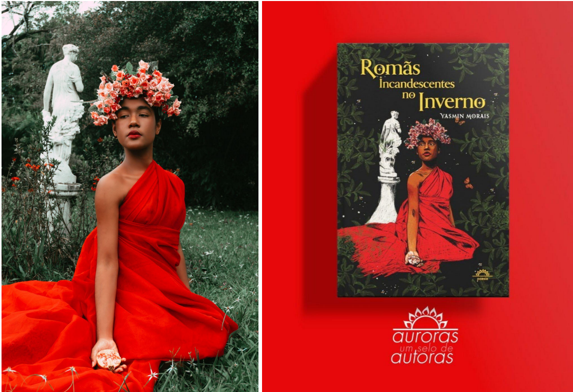
edição de capa promocional por Editora Penalux

Romãs incandescentes no inverno é a primeira obra solo publicada pela escritora, jornalista e ativista social baiana Yasmin Morais. O livro, que se trata de uma coletânea de poemas e prosa poética inspirada no Mito de Perséfone, deusa grega da Primavera e rainha do Submundo, foi publicado no ano de 2022 pelo Selo Auroras da editora paulista Penalux durante a estadia da escritora na França.