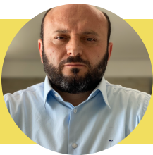
PROFESSOR MUSTAFA GOKTEPE INSTITUTO PELO DIÁLOGO INTERCULTURAL